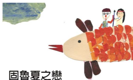
固魯夏之戀 Smdamat bi alang Kulu