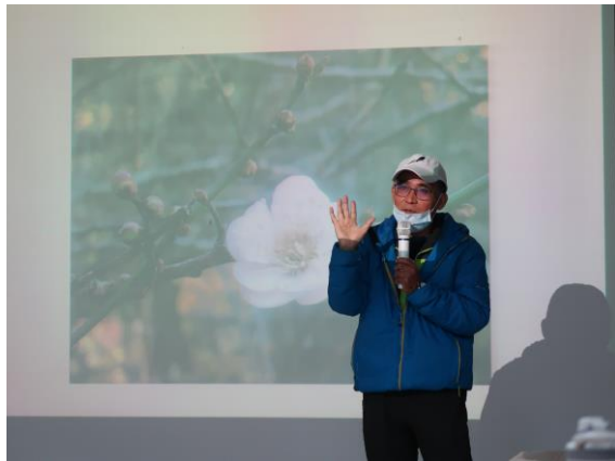
講師講解特有動植物