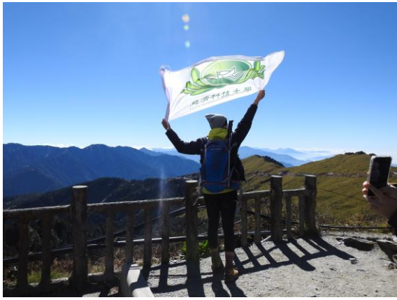
同學舉校旗與合歡山合影