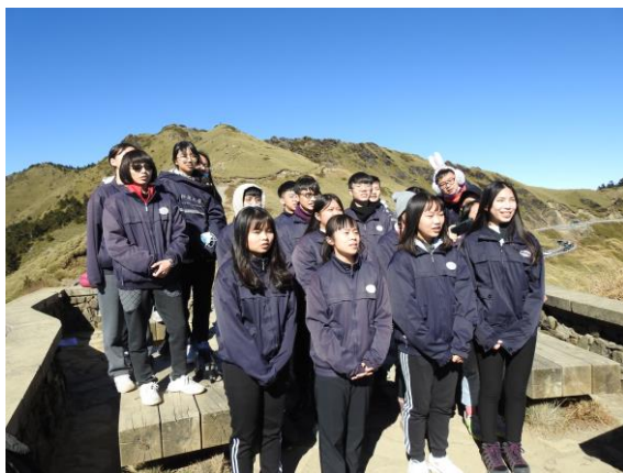
在合歡山上唱校歌