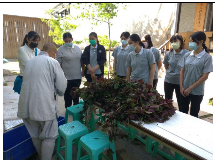
師父講解如何挑蟲卵