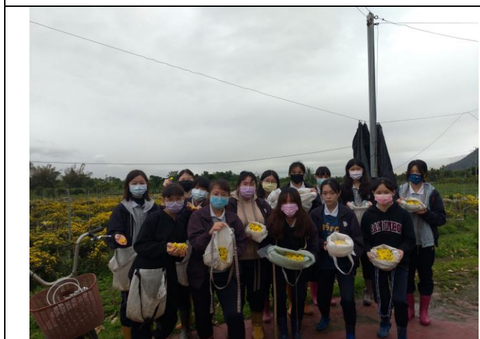
同學們辛苦的成果